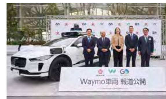
令和7年4月 タクシー事業者等が自動運転車両（レベル4）を公開

タクシー業界においても、現在のタクシー事業と同等か、それ以上の安全性がタクシー事業者の責任において確保されることを基本として、自動運転タクシーの社会実装に向けて取り組みを進めます。