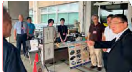
古川前・国土交通副大臣視察

令和7年8月6日・7日に「こども霞が関見学デー」が開催され、霞が関周辺のタクシー乗車体験を通じて、タクシーを身近に感じてもらいました。また、乗車したこどもたちには乗車体験証明書をプレゼントしました。