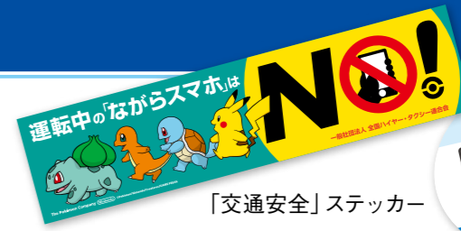
「交通安全」ステッカー