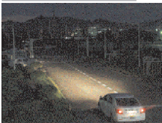
ロービームで撮影