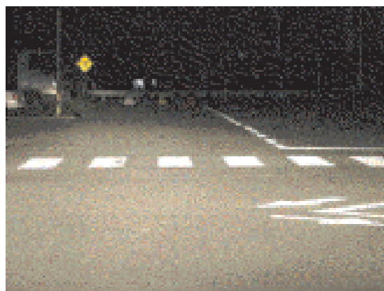
ロービームで撮影