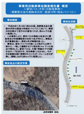
軽井沢スキーバス事故