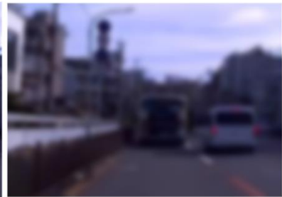
視力の違いによる見え方の違い