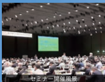
セミナー開催風景