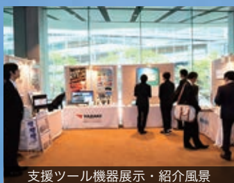
支援ツール機器展示・紹介風景

本セミナーへのご参加は 「現地での対面参加」または「オンライン配信参加」 からお選びいただけます。