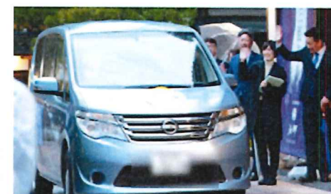
▲公共ライドシェアの立ち上げ（イメージ）