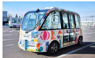
自動運転バスの運行